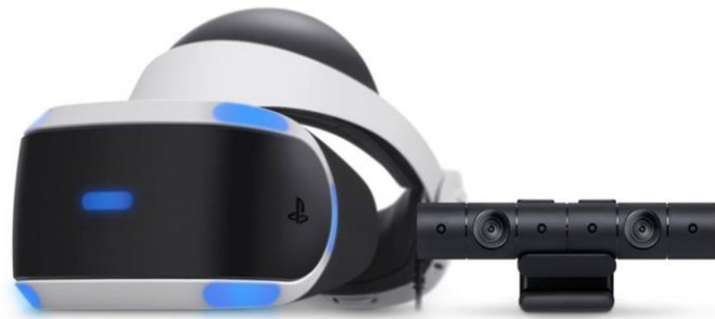
Abbildung 4: PlayStation VR mit Kamera

Generation nicht mehr weiterentwickelt wird. Somit sind Forschungen und Softwareentwicklungen für die Industrie zum aktuellen Zeitpunkt noch nahezu nicht durchgeführt, wenngleich ein großes Potential in VR-Brillen für die Industrie steckt.