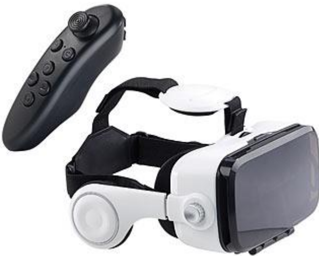
Abbildung 3: Mobile VR-Brille

High-End VR-Brillen nutzen im Gegensatz zum Smartphone einen Computer (bspw. Oculus Rift oder HTC Vive) oder eine Konsole (bspw. Sony PlayStation VR) als Prozessor, an den die Brille angeschlossen wird. Dadurch sind sie leistungsstärker als die zuvor vorgestellten Lösungen und unterstützen auch anspruchsvolle VR-Anwendungen, die eine interaktivere und immersivere Erfahrung erlauben. Die VR-Brillen werden oftmals in Kombination mit weiteren Systemkomponenten angeboten, beispielsweise